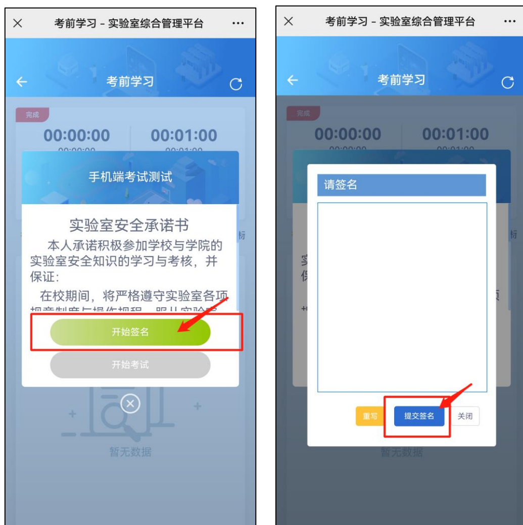
图 6 考前承诺界面

4. 签署考前承诺： 正式考试前需要签署考前承诺书，在弹窗中点击【开始签名】，签名完成并提交后，即可正式考试。