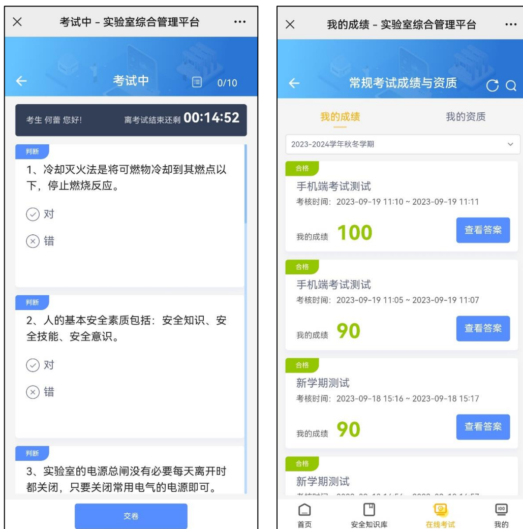
图 7 考试界面及成绩界面